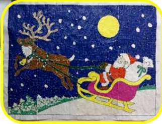
思い出の スライドショー