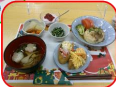
おせちの 貼り絵 おいしそ～