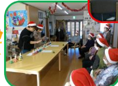
ハンドベル いい音色♪