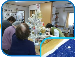
ツリーの飾りつけ