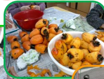
頂いた柿で 干し柿作り